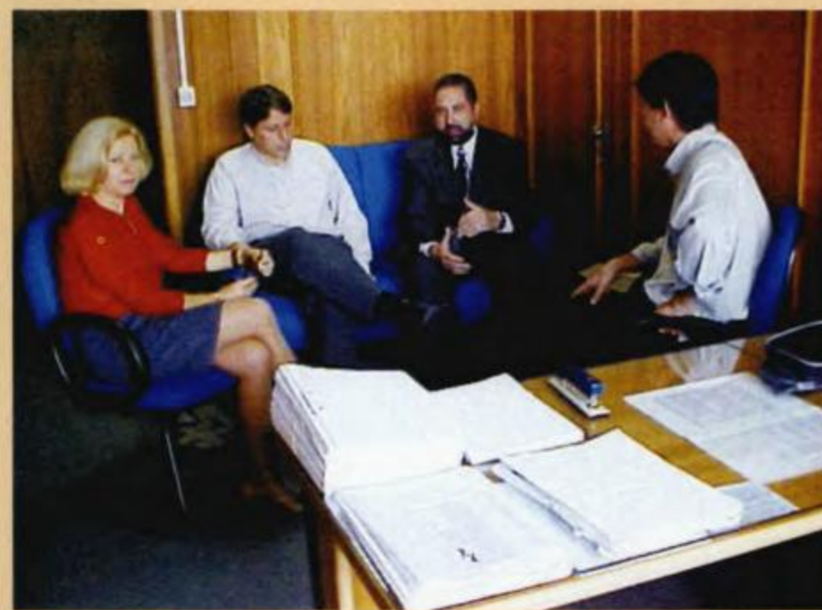
Diretoria do Affep Sindical se reúne com o Diretor da CRE para discutir a aprovação do plano de carreira

Affep Sindical está atendendo em novo telefone: 221-5300