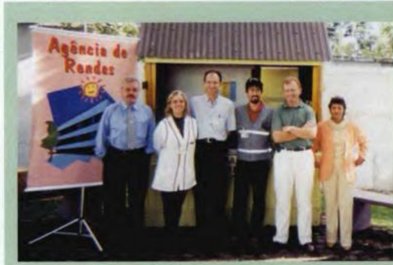
Agentes fiscais apresentam projeto "Vendinha do Fisco" às escolas de Curitiba

A apresentação do projeto "Vendinha do Fisco" na "Boca Maldita" é apenas o pontapé inicial para o desenvolvimento de outras atividades deste porte visando sempre a valorização do Fisco.