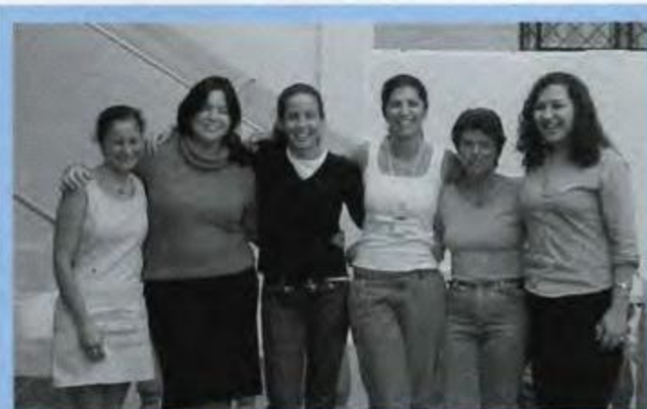
O trabalho de voluntariado será coordenado por esta equipe

Um dos agentes mais importantes para o funcionamento e efetividade do projeto é a participação de voluntários . Sem eles, dificilmente, os objetivos serão alcançados. O trabalho voluntário é uma prática cívica, uma forma de exercício de cidadania, que transfor-